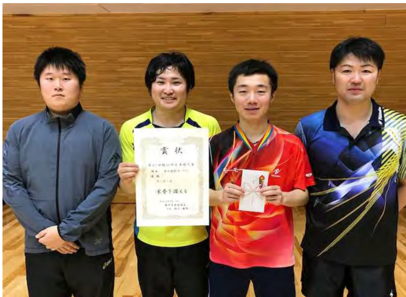
前回男子団体の部優勝：モーモーA

日時 平成31年3月16日(土)～17日(日) 午前8時40分 会場 奥州市総合体育館 主催 奥州市卓球協会