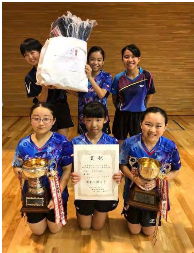
前年度女子団体優勝校：center blue (岩手)

〒023-0132 岩手県奥州市水沢羽田町うぐいす平72番地 TEL 0197-22-7000 FAX 0197-22-7001