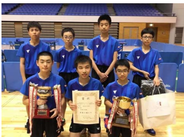
前年度男子団体優勝：岩手県・花巻中学校

〒023-0132 岩手県奥州市水沢羽田町うぐいす平72番地 TEL 0197-22-7000 FAX 0197-22-7001