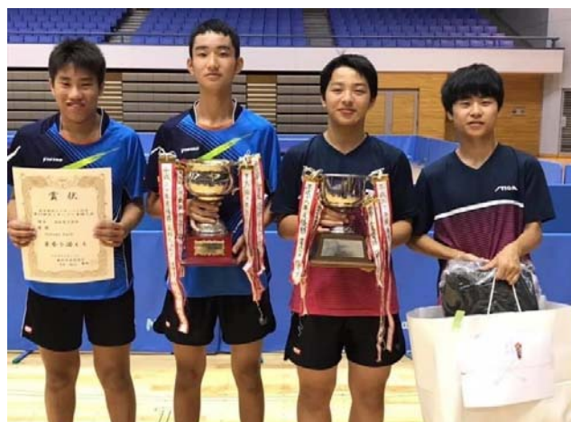
前年度男子団体優勝：岩手県・Autumn Rock