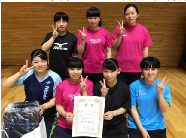
前年度女子団体優勝：宮城県・迫桜高等学校