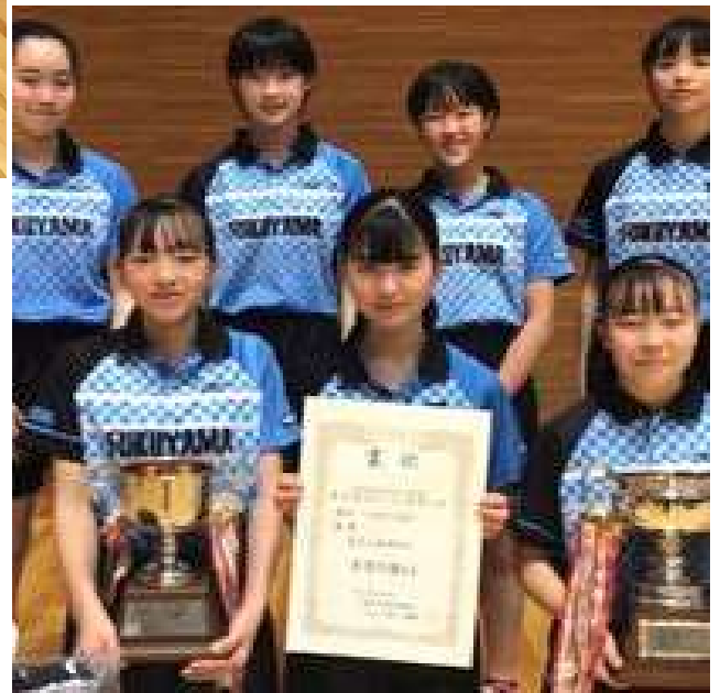
令和4年度女子団体優勝：福島県・富久山卓球クラブ