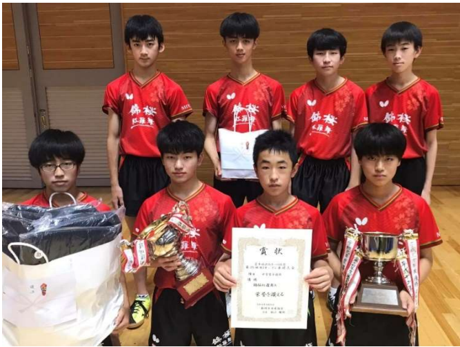
令和4年度男子団体優勝：宮城県・錦桜紅羅舞A

〒023-0132 岩手県奥州市水沢羽田町うぐいす平72番地 TEL 0197-22-7000 FAX 0197-22-7001