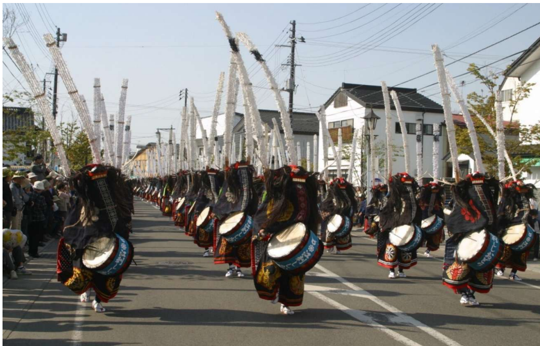
岩手県江刺百鹿群舞

日程 令和7年1月13日（祝月） 午前9時00分～ 受付 午前9時30分～ 開会式 会場 奥州市江刺中央体育館 （岩手県奥州市江刺杉ノ町9-1） 主催 奥州市卓球協会