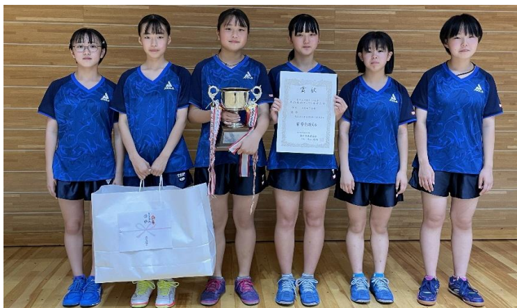
令和6年度女子団体優勝：宮城県・松山三本木スポ少A