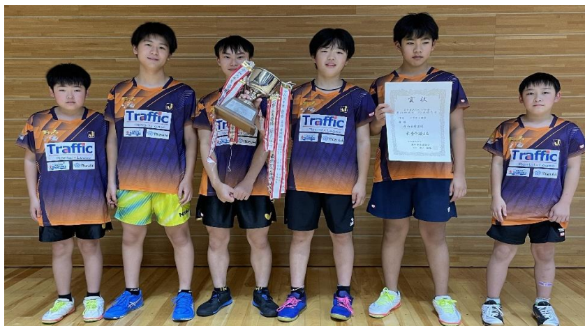
令和6年度男子団体優勝：秋田県・県南卓球道場

〒023-0132 岩手県奥州市水沢羽田町うぐいす平72番地 TEL 0197-22-7000 FAX 0197-22-7001